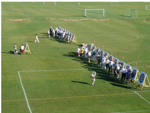
Blick von oben auf das Turniergelände

Nach mehreren Jahren Pause organisierte der BVB 2008 endlich wieder einmal ein 70m – FITA Turnier. Da wir in den letzten Jahren viele Neumitglieder aufgenommen haben, war für die Mehrzahl der Helfer die Organisation eines solchen Turniers neu. Dies bedeutet einen entsprechenden zusätzlichen Aufwand bei der Vorbereitung. Ein Rückblick auf die Erfahrungen zeigt aber, dass dieser Anlass auch für das Vereinsleben von Bedeutung ist: Nachdem alles wieder versorgt war, sassen mehr als ein Dutzend Vereinsmitglieder nach getaner Arbeit gut gelaunt am Sonntag um 20 Uhr noch im Hoselupf bei einem Bierchen. Es herrschte eine gelöste Stimmung.